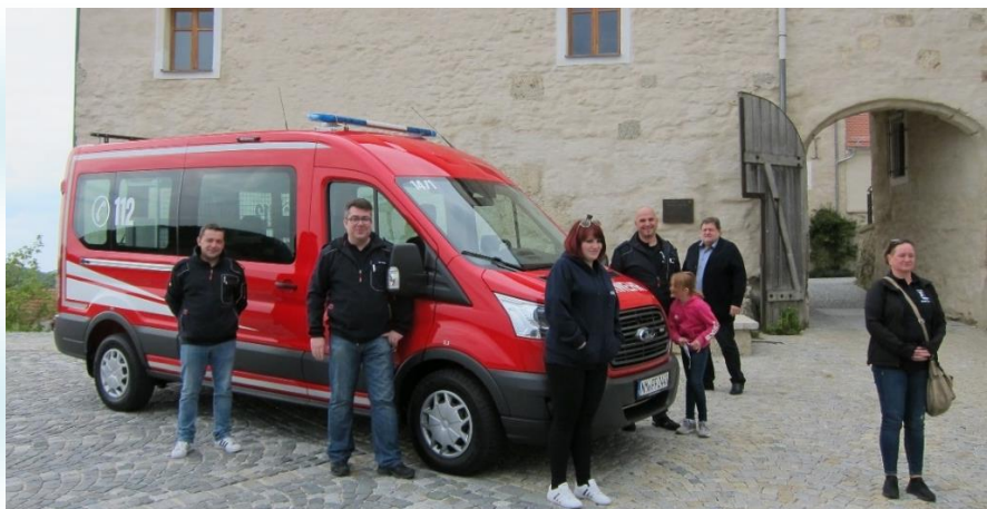
Der neue Mannschaftstransportwagen der Feuerwehr

Sehr zur Freude der aktiven Mannschaft konnte der nagelneue umgebaute 9-Sitzer Ford-Transit nun in Kronach abgeholt und auf den Markt Lupburg zugelassen werden. Das neue Fahrzeug kann auch von den Feuerwehren See und Degerndorf genutzt werden.